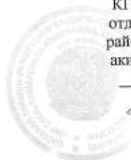
График оказания государственных услуг

«Прием документов и зачисление детей в дошкольные организации»